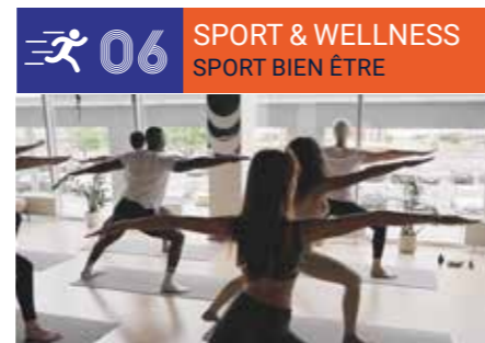
Sport, Health, Society & Education ■ Sport, Santé, Social Education