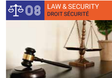
Security, Law, the Public Sector and Institutions ■ Sécurité, Droit, Vie Publique et Institutionnelle