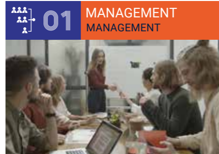
Management, Organisational Strategy & Human Resources ■ Management, Gestion et Stratégies des Organisations et des Ressources Humaines