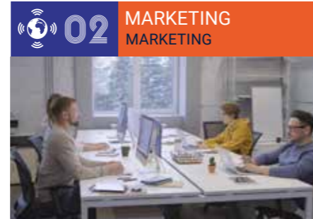
Trade, Marketing, Communications & Media ■ Commerce, Marketing, Communication, Médias