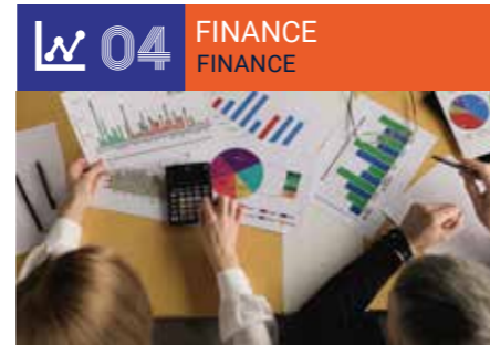
Banking, Finance, Insurance & Wealth Management ■ Banque, Finance, Assurance, Patrimoine