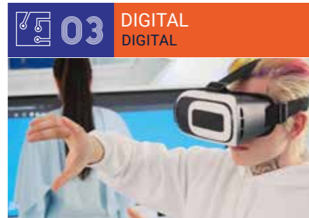
IT, Digital Tools & Technology ■ Informatique, Digital, Technologie