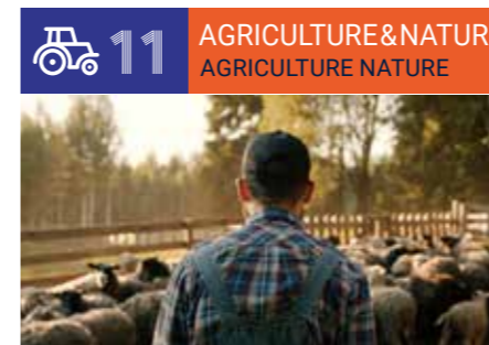
Nature, Agriculture & Farming ■ Nature, Agriculture, Elevage