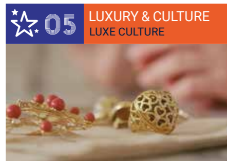
Creative Arts, Culture, Luxury & Artisanhip ■ Création, Culture, Luxe, Artisanat d'Art