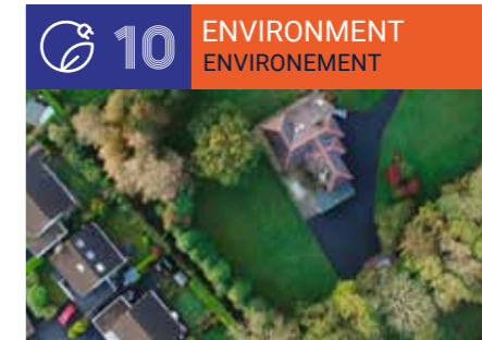
Environment, Natural Resources & Sustainable Development ■ Environnement, Ressources Naturelles, Développement Durable