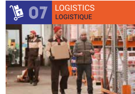
Transport, Logistics & Quality Assurance ■ Transport, Logistique, Qualité