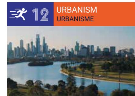
Architecture, Urbanism, Construction & Public Works ■ Architecture, Urbanisme, Bâtiment et Travaux Publics