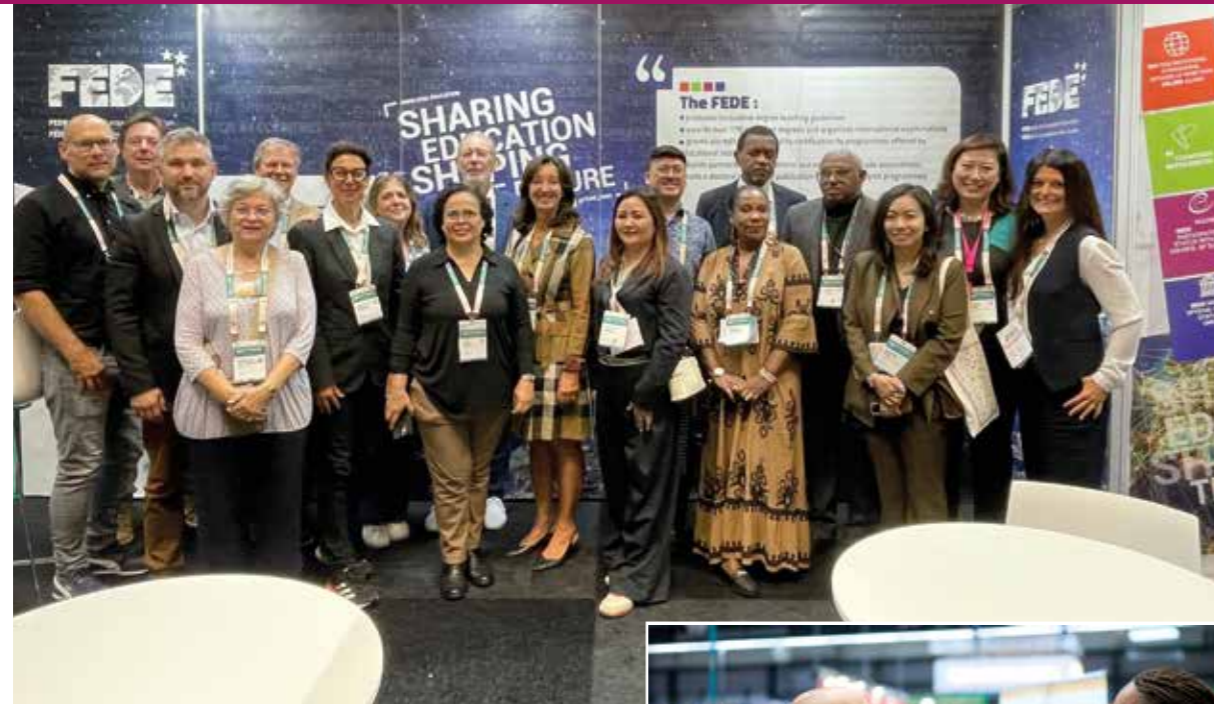
The FEDE at the 2025 EAIE Exhibition, Gothenburg, Sweden La FEDE au salon EAIE 2025, Göteborg, Suède