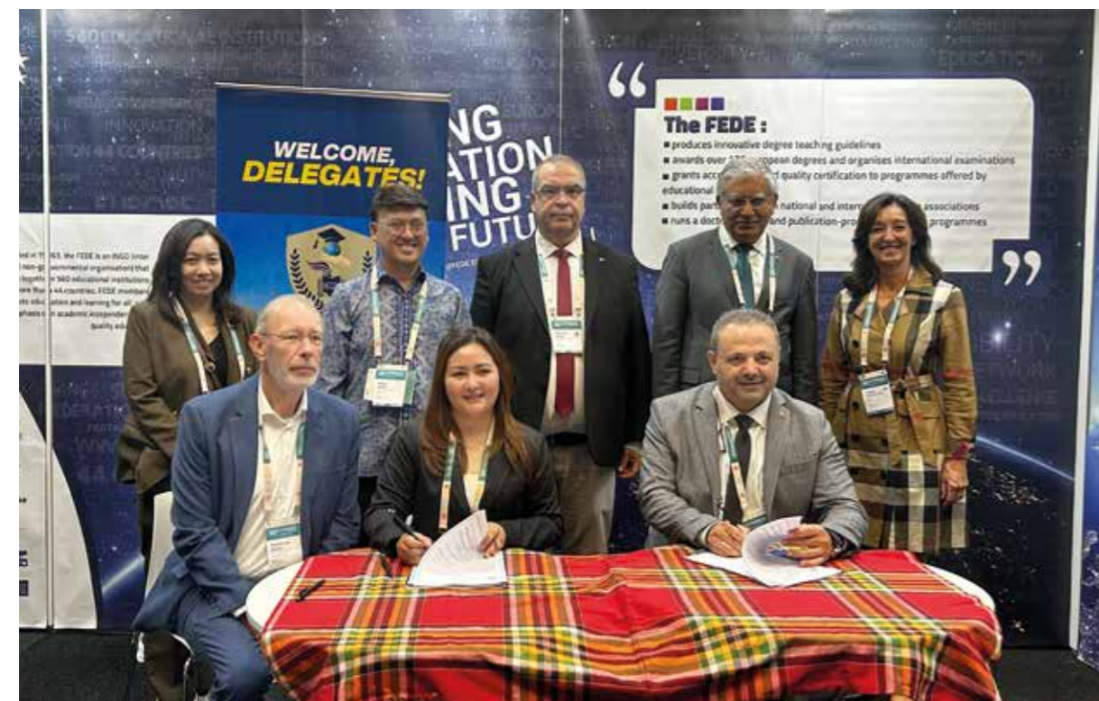
Signature of an MoU between HCCCI (Philippines) and Aksaray University, Turkiye Signature d'un protocole d'accord entre HCCCI (Philippines) et Aksaray University, Turquie